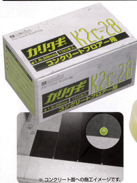
※ コンクリート面への施工イメージです。